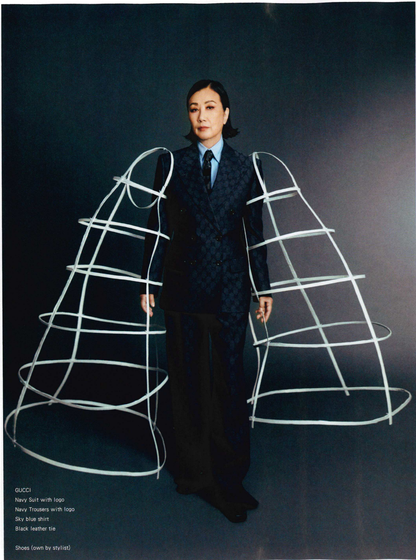
GUCCI Navy Suit with logo Navy Trousers with logo Sky blue shirt Black leather tie Shoes (own by stylist)