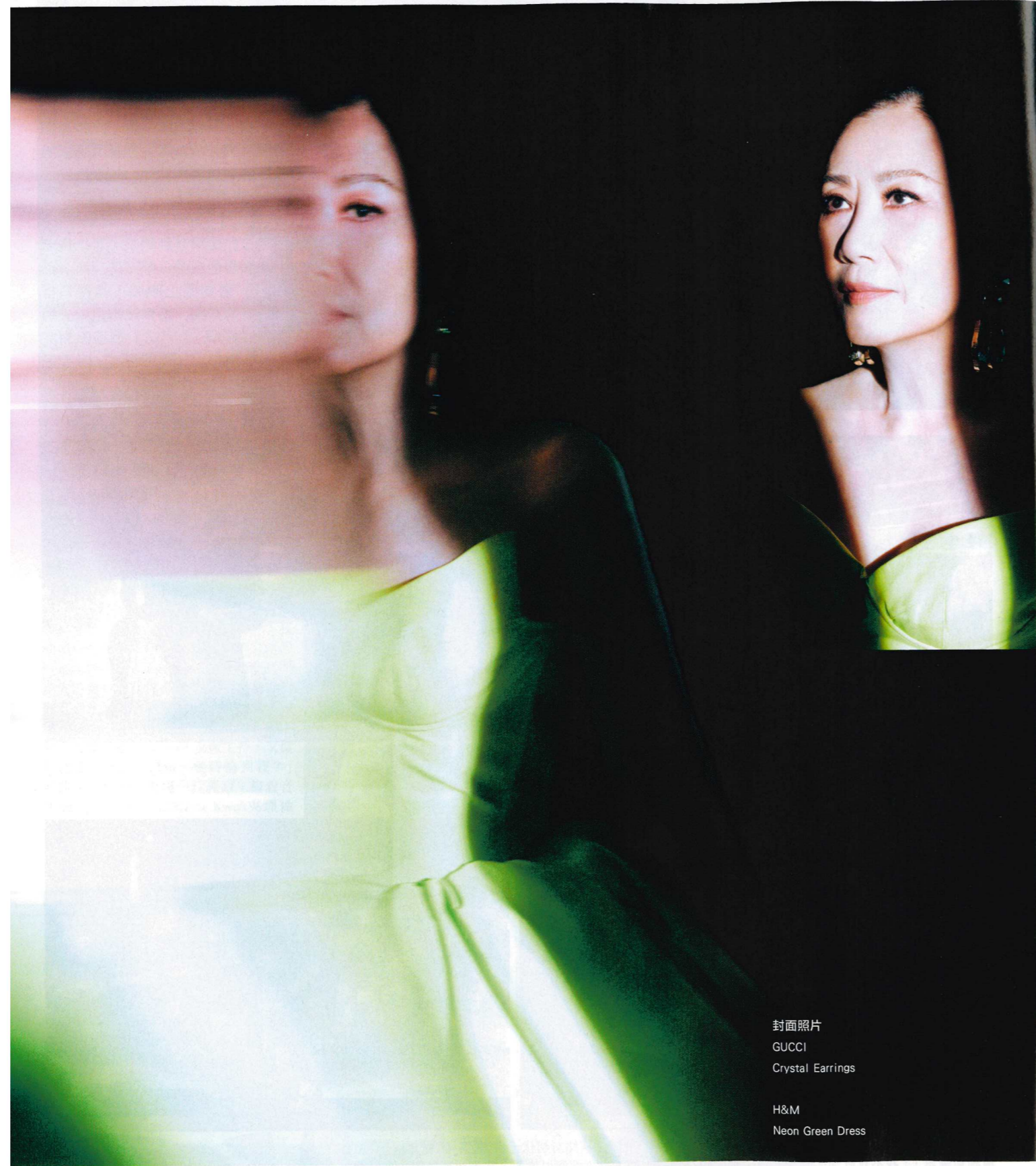
封面照片 GUCCI Crystal Earrings H&M Neon Green Dress