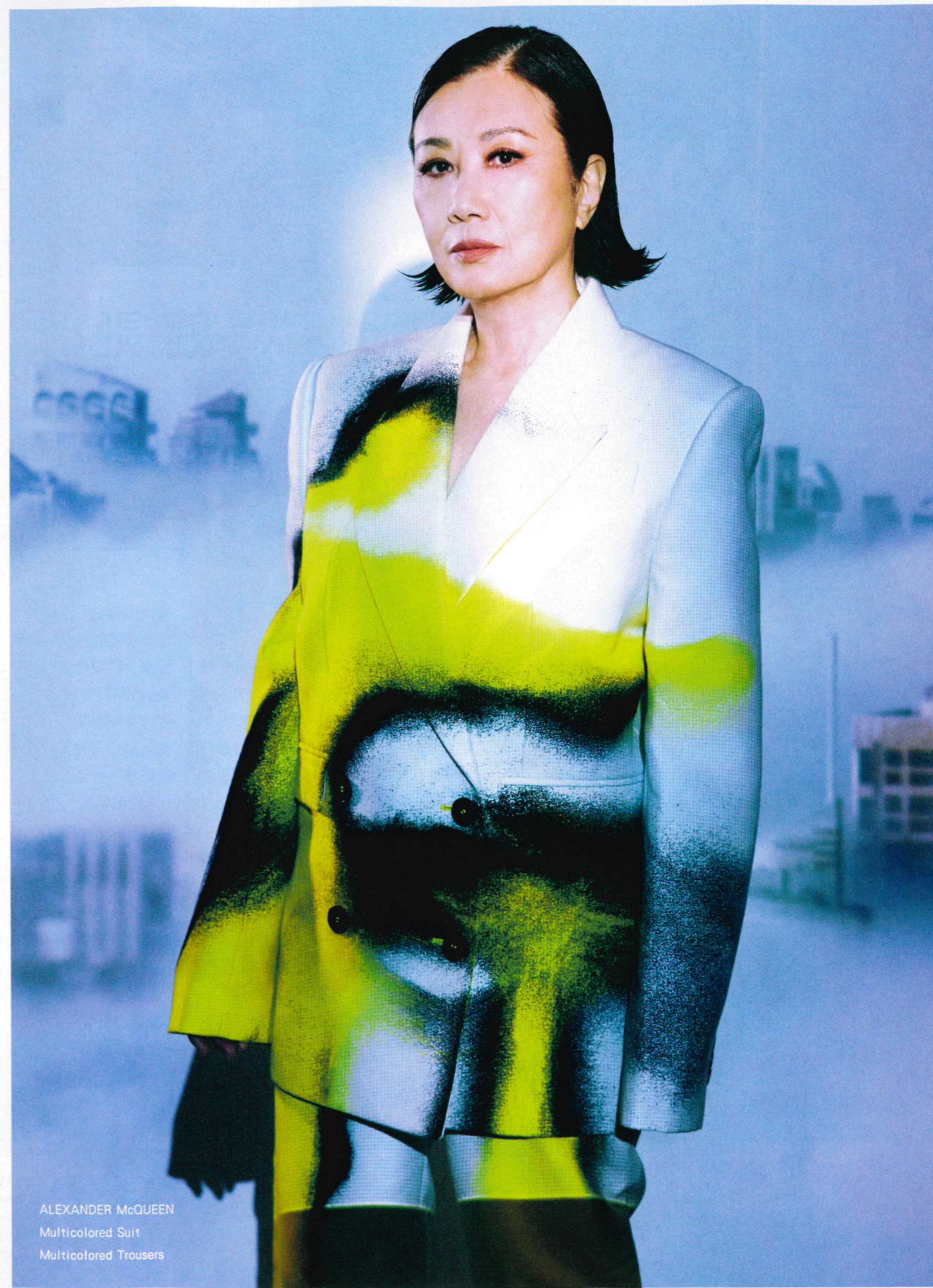
ALEXANDER McQUEEN Multicolored Suit Multicolored Trousers

阿姐在演藝界出名「活到老學到老」，而且不斷加大投資力度，投身粵劇界更是不惜工本，每演一套新戲，都由曲藝名家梁素琴設計唱腔，功架就由劉洵老師傳授。「福陞劇團」12月14日將在西九戲曲中心開鑼演出七場，其中一套由羅家英為阿姐新編的《修羅殿》，阿姐的角色有多種變化很考功夫，被戲迷視為重頭戲熱切期待。●