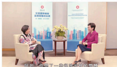
阿姐，你問了一些很政治性的問題